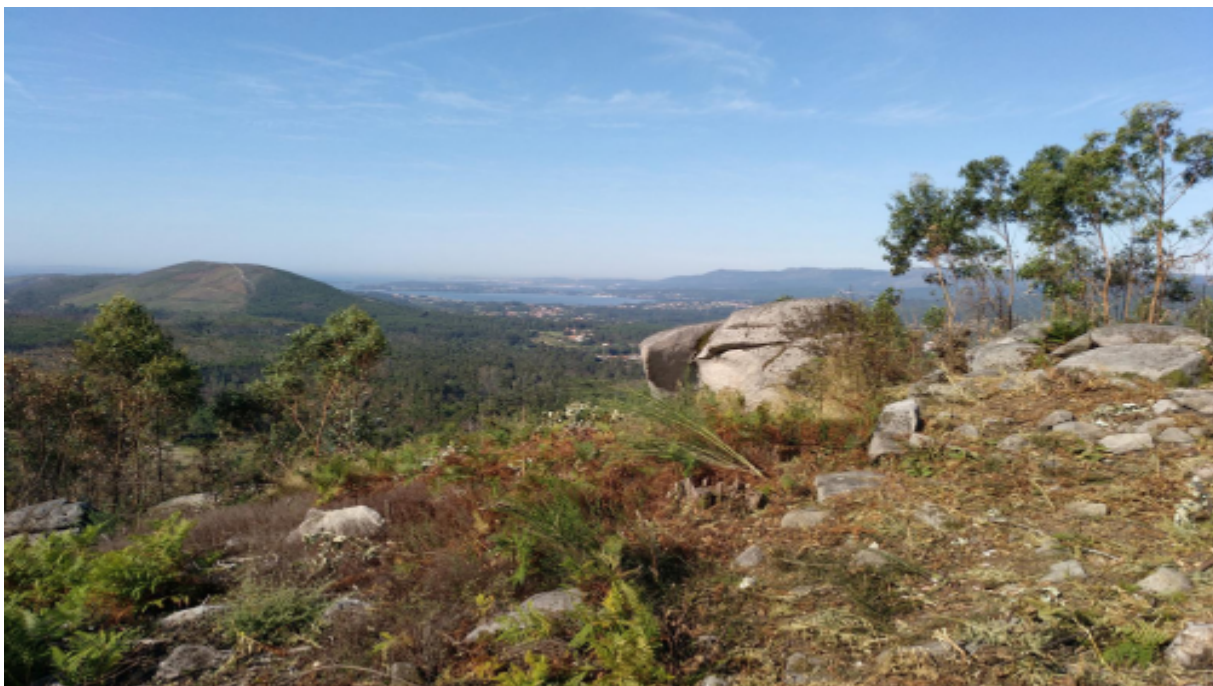
Imaxe: Sendeiros de Dodro | Concello de Dodro

Castro de forma alongada con dúas coroas ao oeste, e outra ao leste, delimitadas por sendas murallas e terrazas intermedias. Intensificáronse tres murallas defensivas e as bases do asentamento.